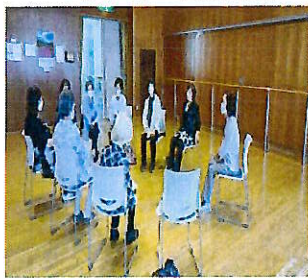
ふれあい福祉相談