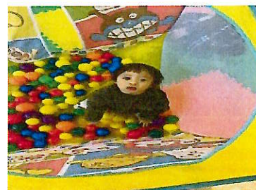
子育て広場「ひよこ」