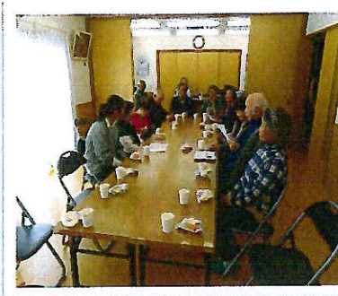
真田ウッドパークサロン