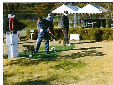
福祉スポーツ大会