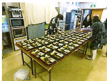
高齢者ふれあい給食