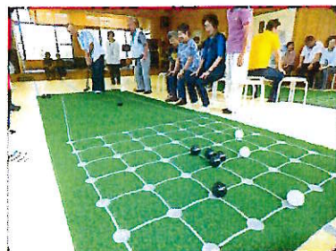
ふれあいサロン・七国荘