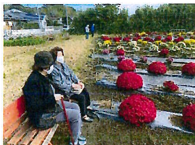
ふれあいサロン ざる菊園