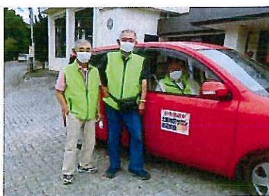
サロン送迎（土屋地区）