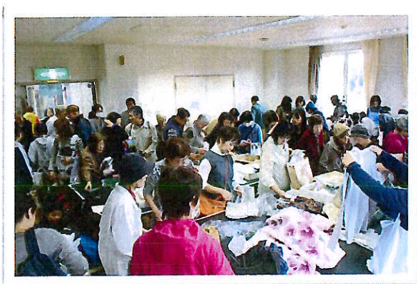
ふれあい広場(バザー)