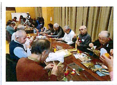
ふれあいサロン12月 お正月飾り作り