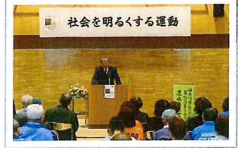
11月 社明運動講演会