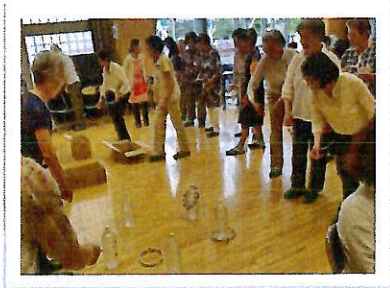
ふれあいサロン7月 輪投げゲーム