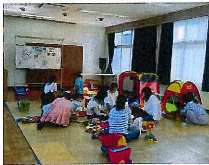
子育て広場のびのび