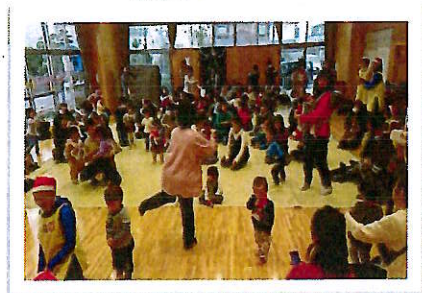
びよびよ12月 音楽に合わせて踊ろう