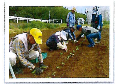
ふれあい農園5月 枝豆の定植