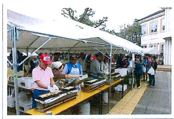
ふれあい広場(各種団体による売店)