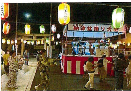
ふれあい納涼盆踊り大会