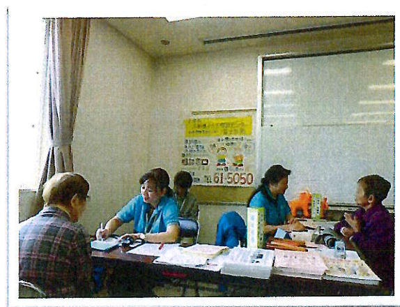
ふれあい広場(地域包括支援センターの健康相談)