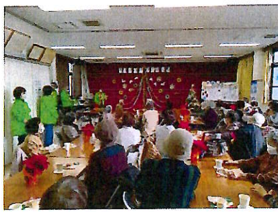
ふれあいクリスマス食事会