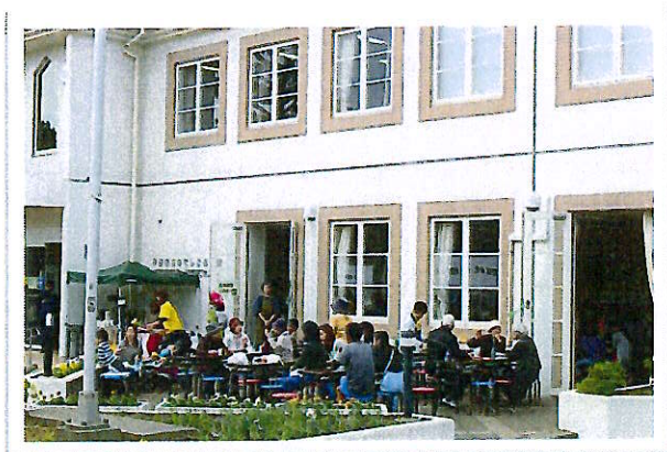
ふれあい広場(喫茶・食事コーナー)