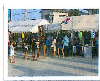
四之宮地区夏祭り大会(カキ氷販売)