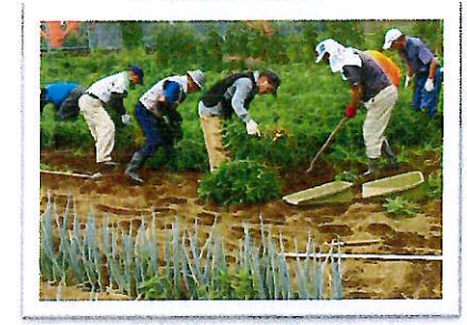
ふれあい農園8月 落花生の収穫