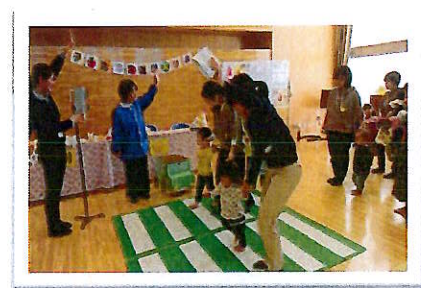
びよびよ11月 交通安全教室