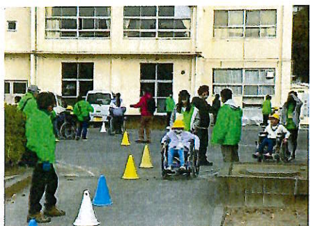
ふれあいフェスティバル(車いす体験)