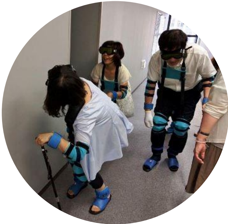
高齢者疑似体験 (80歳代の体験)