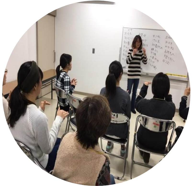
聴覚障がい者の理解と手話体験