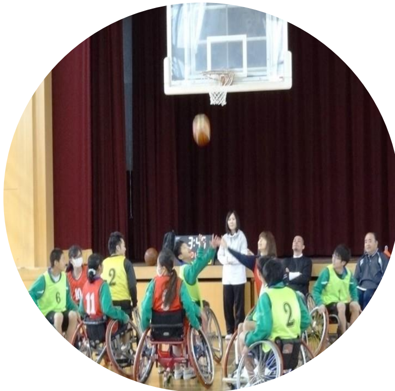
障がい者スポーツの講話と 車椅子バスケット体験