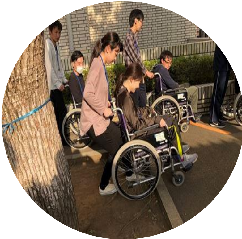
車椅子体験 (自走・介助)