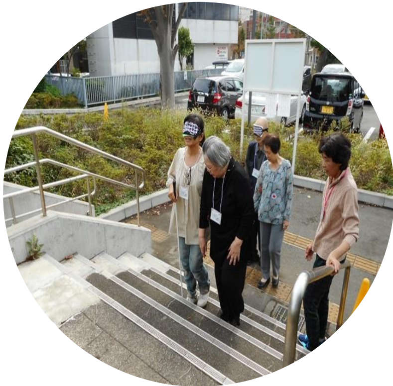
視覚障がい者の理解と誘導法体験